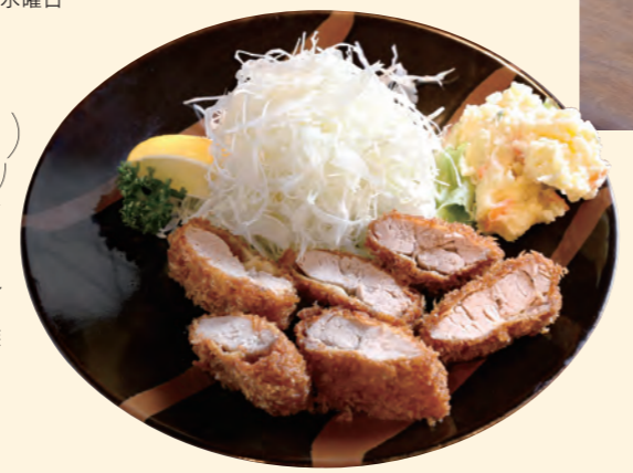
ヒレかつ定食 (小鉢・豆腐・ライス・味噌汁・デザート付)

日本四大そば処の一つである白河で、江戸時代から続く創業200余年の老舗蕎麦店。当時の白河藩主も好んだ蕎麦は、香り高くコシが強いのが特徴です。 TEL:0248-23-2040 [所在地] 福島県白河市本町28 [営] 11:00~19:00 [休] 水曜日