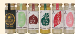
山口こうじ店 老舗こうじ屋が造った麹甘酒