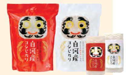
白河市産米需要拡大推進協議会 白河産コシヒカリ【だるまパッケージ】