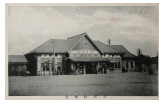
▲大正時代後期～昭和時代初期の白河駅(当時の絵はがきより)

福島県中通りの南部に位置し、栃木県と隣接した白河市。首都圏から新幹線で約70分移動するだけで、歴史や文化、豊かな自然を体感できます。白河では城下町地区に残る歴史や文化資源を守り、活用したまちづくりを進めており、歴史的建造物や伝統行事、伝統技術などが継承され、未来へつなげていくサステナブルな街です。 変わらないものを探しながら、変わったところと見比べてみたり、どのように維持、進化させているのかわを見つめるのも白河旅ならではの。歴史があるからこそ新しいものがより新鮮に映る。そんな街並みに触れてみてはいかがでしょうか。