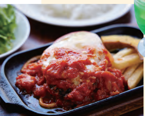
トマトチーズハンバーグ(サラダ・ライス付)とミニメロンフロート