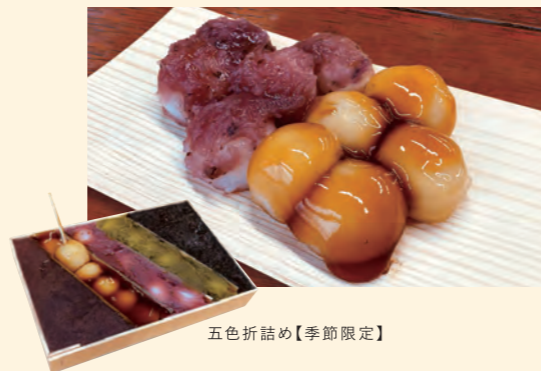
五色折詰め【季節限定】

約100年、変わらない味を継承する名物の団子は、一口サイズの柔らかい食感です。 TEL:0248-23-3679 [所在地] 福島県白河市五郎窪40 [営] 10:00~15:00 [休] 金曜日