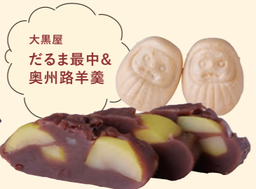
大黒屋 だるま最中& 奥州路羊羹