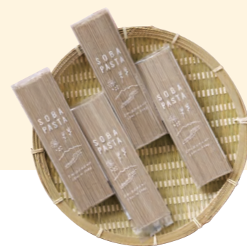
株式会社カタノ 白河市産蕎麦使用 そばパスタ