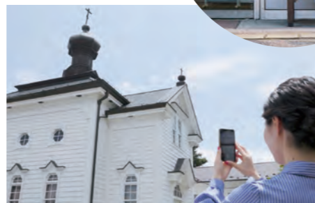
(Shirakawa Orthodox Church of Christ)