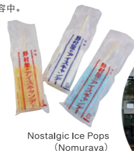
Nostalgic Ice Pops (Nomuraya)