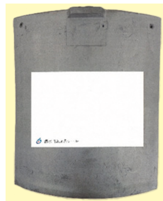
記名シールを貼ったイメージ