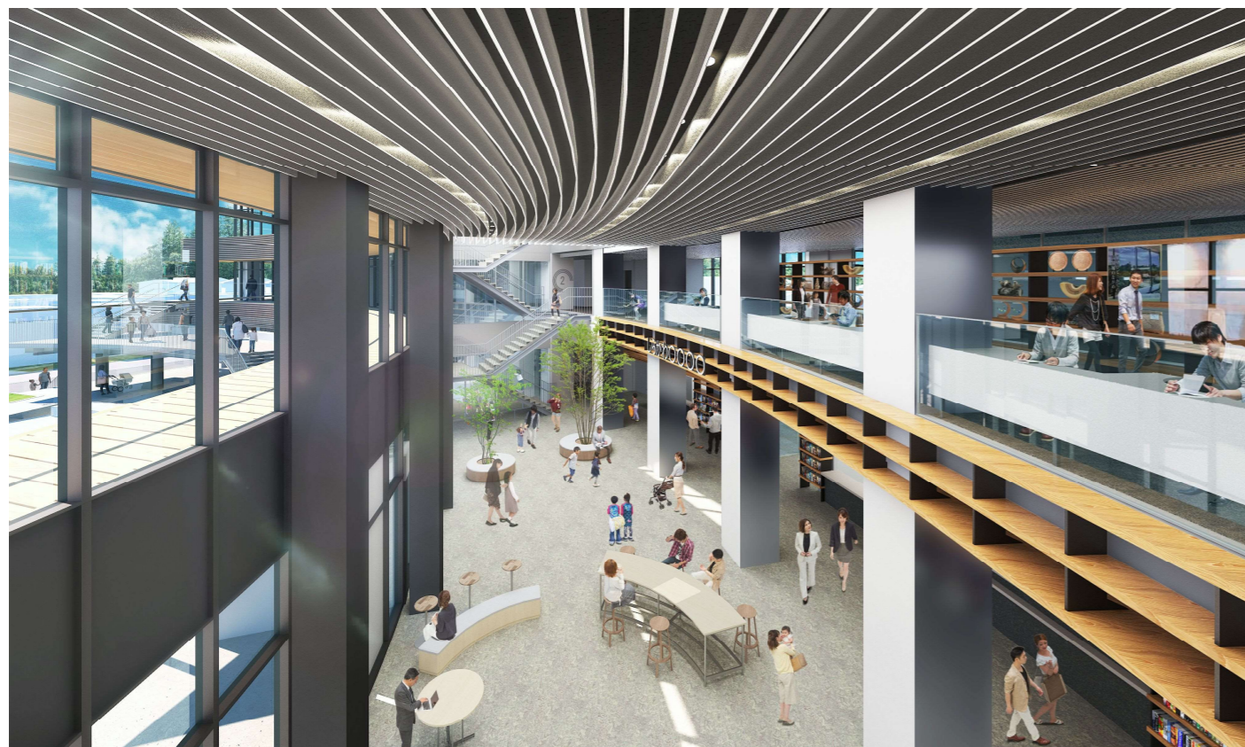
⑦ 2階研修室から1階市民交流スペース