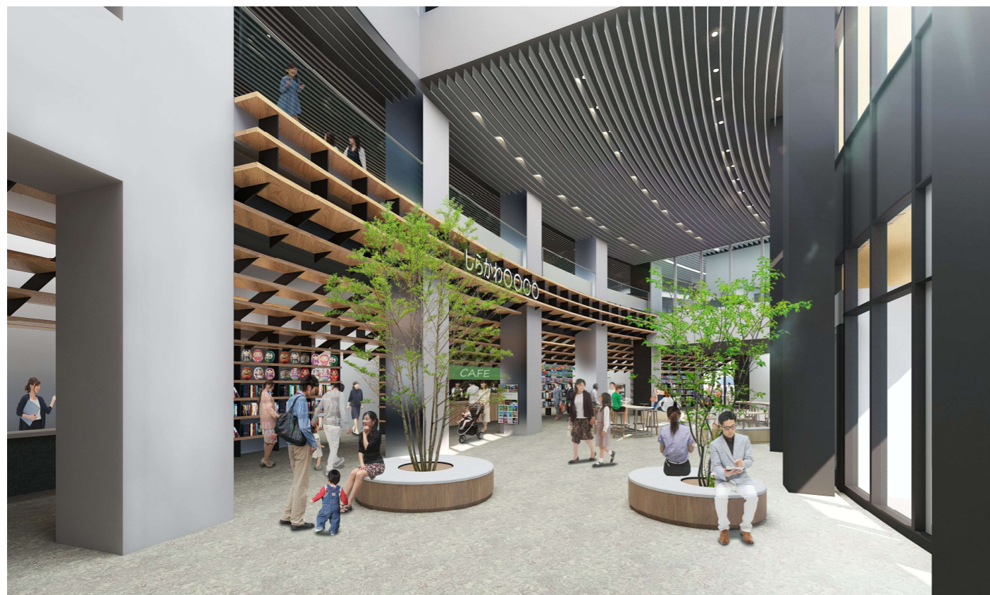
⑤ 1階市民交流スペース内観