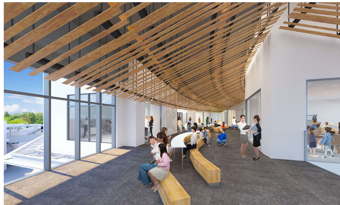
⑧ 3階共用部（中央階段から工作室方面）