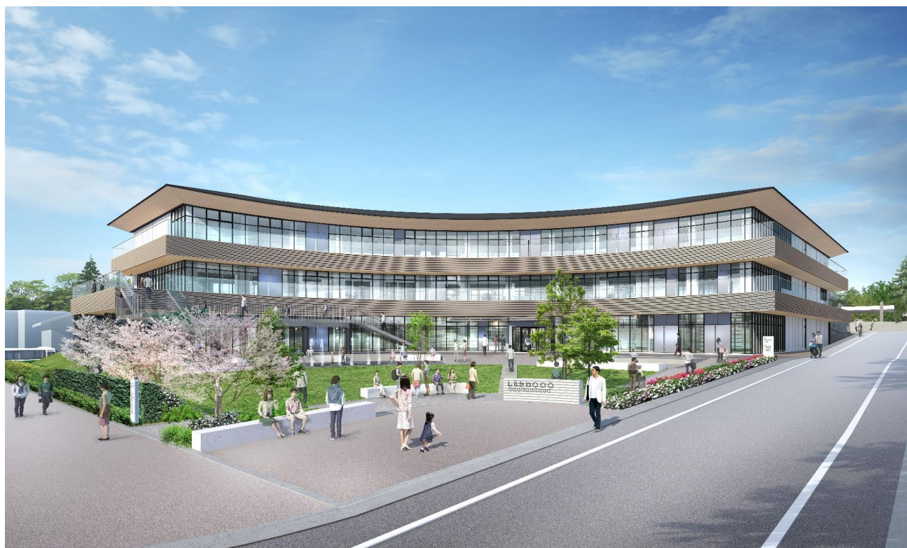
外観イメージ（実施設計）