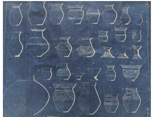
昭和25年調査時の出土土器実測図