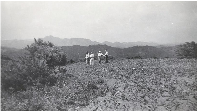
昭和25年(1950)発見当時の天王山遺跡