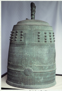
▲銅鐘（叢勝寺） （龍蔵寺所蔵、歴史民俗資料館寄託）