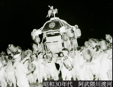
昭和30年代 阿武隈川渡河