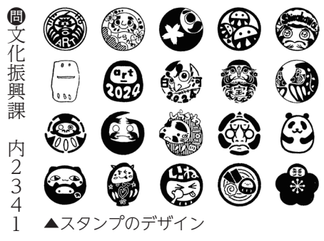
▲スタンプのデザイン