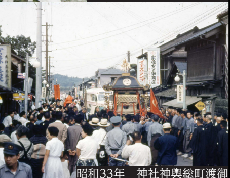
昭和33年 神社神輿総町渡御