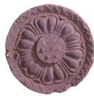
◀ 複弁六葉蓮華文軒丸瓦 (借廃寺跡出土品) (県指定文化財)