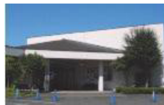
白河市歴史民俗資料館

しかし、その一方で収蔵資料の増加に伴い、資料館収蔵庫のスペース不足が大きな課題となっている。また、発掘調査等で出土した資料の収蔵施設が各所に点在しているため、一括管理・保存を図ることが困難な状況となっている。今後は、財政状況を勘案し、施設改修計画や新たな収蔵施設の確保に努めていく。