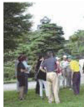
ツーリズムガイド白河による 小峰城の観光案内

この他、文化財の保存・活用に関わっている住民・NPO等各種団体については、文化財ごとに組織された保存・活用団体が主となっている。特に、南湖公園で行われるイベント等については、「南湖を守る会」などの各市民グループや関係機関、NPO法人等が協力・連携して行っている。さらに年1回行われている清掃活動では、多くの市民団体や一般市民が参加し、市民ぐるみの活動を行っている。