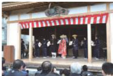
地域の民俗芸能を披露する中学生