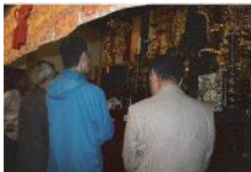
文化財保護審議会現地視察

本市の文化財の保存・活用に関する業務は、建設部文化財課（文化財保護係4名・史跡整備係7名）で担当している。文化財保護係には学芸員（歴史・美術・民俗 各1名）を置き、史跡整備係には埋蔵文化財の専門職員が3名（うち学芸員 1名）配属されている。