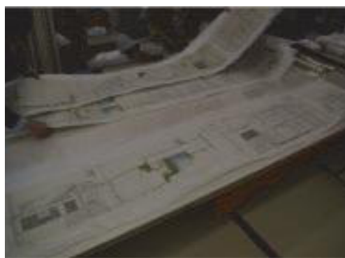
白河城御櫓絵図（県指定文化財）の修復