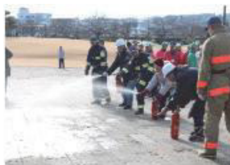
消火器による火災防御訓練