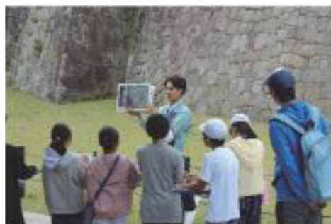
白河の歴史・文化再発見事業の様子