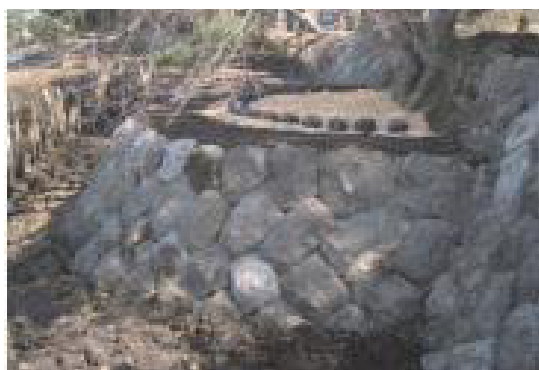
史跡及び名勝南湖公園の護岸整備