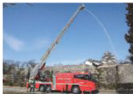
梯上放水訓練の様子

文化財を災害から守り、後世に正しく引き継ぐためには、管理体制の整備が不可欠である。白河市では、「白河市地域防災計画」を定め、文化財管理者への指導として、定期的な防火診断の受診や自主的な点検の実施による火災発生防止と火災原因の早期発見、消火・警報設備の整備促進などのほか、災害防止のため文化財保存施設の整備として、耐火耐震設備の設置を推進している。現在のところ、消防法で耐火設備の設置を義務付けられている重要文化財（建造物）はないが、火災発生の際、迅速に対応できるよう、義務付けられていない文化財についても自