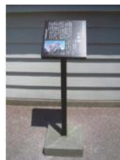
指定文化財説明板