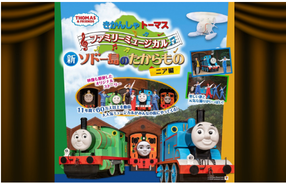
(企画・制作) きかんしゃトーマス実行委員会

トーマスとパーシーがテレビを飛び出してステージを駆けめぐる！映像を駆使したオリジナルストーリーのファミリーミュージカル！ ●時間 ▷1回目 開演 午後0時30分 開場 午前11時30分 ▷2回目 開演 午後3時30分 開場 午後2時30分 ●会場 コミネス大ホール ●料金 一般 3,300円 (友の会 3,000円) ※税込み ※全席指定 ※好評発売中 ※3歳未満膝上鑑賞無料 (座席が必要な場合有料)