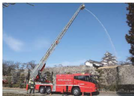
梯上放水訓練の様子

文化財を災害から守り、後世に正しく引き継ぐためには、管理体制の整備が不可欠である。白河市では、「白河市地域防災計画」を定め、文化財管理者への指導として、定期的な防火診断の受診や自主的な点検の実施による火災発生の防止と火災原因の早期発見、消火・警報設備の整備促進などのほか、災害防止のため文化財保存施設の整備として、耐火耐震設備の設置を推進している。現在のところ、消防法で耐火設備の設置を義務付けられている重要文化財（建造物）はないが、火災発生の際、迅速に対応できるよう、義務付けられていない文化財についても自