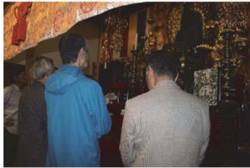
文化財保護審議会現地視察

また、白河市文化財保護条例により、市の諮問機関として文化財保護審議会を設置している。委員は、歴史（中世史）・美術・歴史資料・仏像・建築史・民俗芸能・民俗の専門家7人で構成され、文化財の保存・活用に関する指導・助言を得ている。審議会での検討が困難な分野については、検討委員会や専門委員会を立ち上げる等、適切な審議を行ってきた。今後も、文化財保護行政に対する適切な指導・助言を得ながら文化財の保存・活用を進めていく。