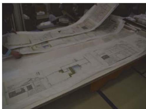
白河城御櫓絵図（県指定文化財）の修復