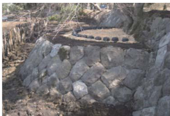
史跡及び名勝南湖公園の護岸整備