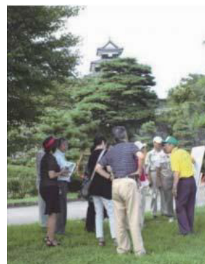
ツーリズムガイド白河による 小峰城の観光案内

この他、文化財の保存・活用に関わっている住民・NPO等各種団体については、文化財ごとに組織された保存・活用団体が主となっている。特に、南湖公園で行われるイベント等については、「南湖を守る会」などの各市民グループや関係機関、NPO法人等が協力・連携して行っている。さらに年1回行われている清掃活動では、多くの市民団体や一般市民が参加し、市民ぐるみの活動を行っている。