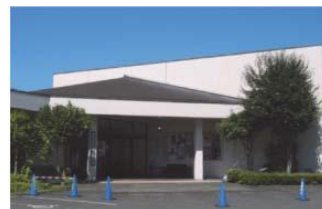
白河市歴史民俗資料館

しかし、その一方で収蔵資料の増加に伴い、資料館収蔵庫のスペース不足が大きな課題となっている。また、発掘調査等で出土した資料の収蔵施設が各所に点在しているため、一括管理・保存を図ることが困難な状況となっている。今後は、財政状況を勘案し、施設改修計画や新たな収蔵施設の確保に努めていく。