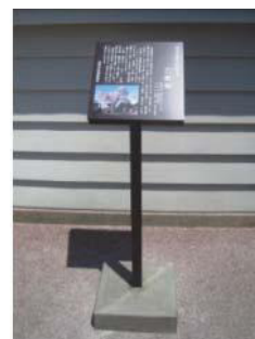
指定文化財説明板