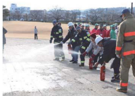
消火器による火災防御訓練