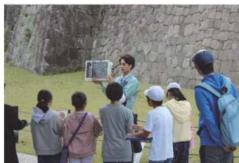
白河の歴史・文化再発見事業の様子