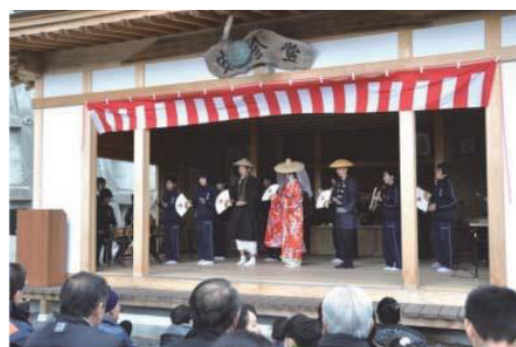
地域の民俗芸能を披露する中学生