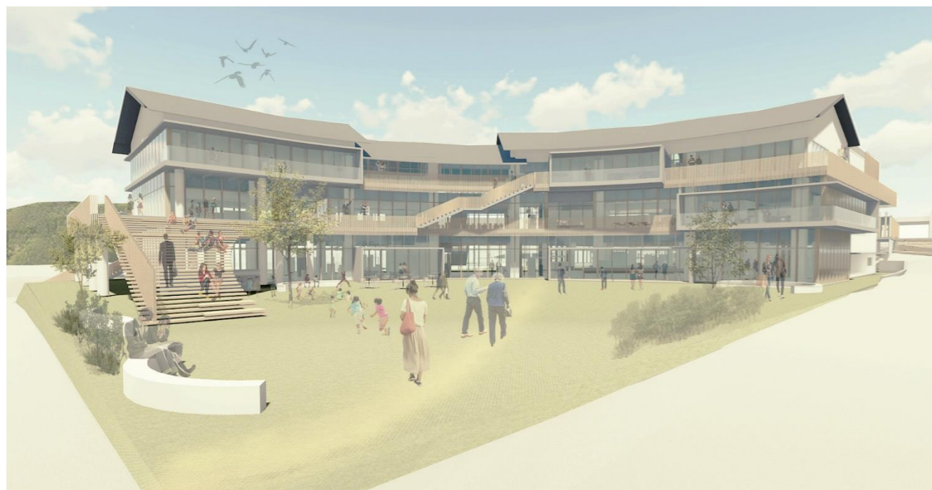
小峰通りから 外観イメージ

小峰城をはじめとする昔ながらの街並みに調和しながらも、内部の多様な活動が感じられ、多くの世代を惹きつけるデザインとします。