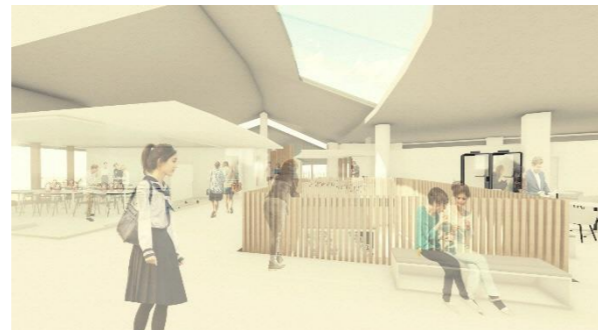
3階 音楽ルーム前の廊下から 内観イメージ

木質系材料等により温もりと開放感がある空間とし、市民の居場所としてにぎわいが溢れるようなデザインとします。