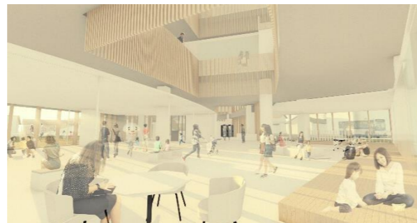
1階 総合健診室前の廊下から 内観イメージ