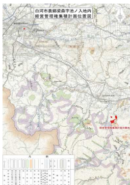
（事業1：森林経営管理事業）

【実績】林地台帳の更新を行い、森林の整備を行うための基礎資料とすることが可能となった。