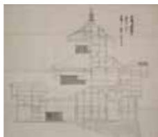
「白河城御櫓絵図」より三重御櫓建絵図

三重櫓は、本丸の北東隅に建つ三層三階の櫓で、小峰城のシンボルとなっています。平成3年(1991)、県の重要文化財である「白河城御櫓絵図」や発掘調査の成果をもとに、木造で復元されました。