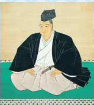
《名君・松平定信》

築造から200年余の時を経た南湖公園は、桜、松、楓など四季折々に優雅な風趣をたたえ、花と緑と水の園として市民をはじめ多くの人々を魅了し続けています。