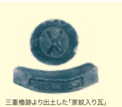
三重櫓跡より出土した「家紋入り瓦」

小峰城本丸と二之丸をつなぐ重要な門である清水門を、三重櫓・前御門に続き、絵図や発掘調査をもとに木造で復元する事業がはじまりました。皆様のあたたかいご支援をお待ちしております。詳細は白河市文化財課にお問い合わせ下さい。[文化財課 ☎0248-27-2310]