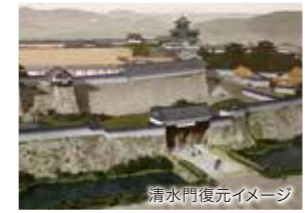
清水門復元イメージ