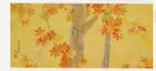
▲下村観山「楓」(渋沢栄一奉納・南湖神社所蔵)