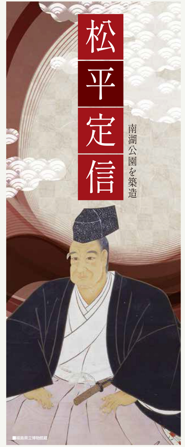
福島県立博物館蔵