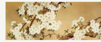
▲橋本永邦「桜」(渋沢栄一奉納・南湖神社所蔵)