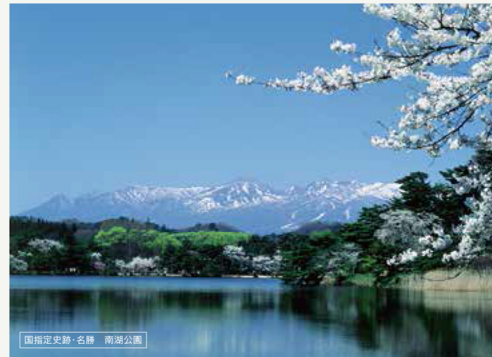
国指定史跡・名勝 南湖公園