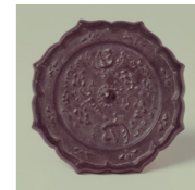
瑞花双鳥八稜鏡 (県指定文化財、歴史民俗資料館蔵)

中田7-1 ☎2310 開館時間 9:00～16:00 休館日 月曜日 入館料 無料 ※6月3日(木)まで、館内くん蒸作業のため臨時休館します。 ●展示内容 ◇平常展示「白河の歴史と文化」