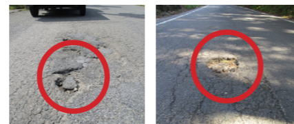
▲補修前の道路の穴ぼこ

● 期間 6月14日(月)～25日(金) ● 通報・問い合わせ先 本庁舎道路河川課 内2228 各庁舎事業課 表郷 ☎24786 大信 ☎2115 東 ☎2114