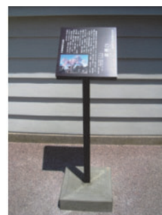
指定文化財説明板