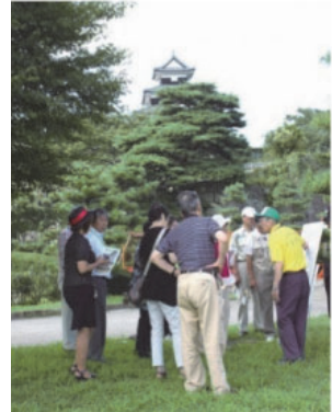
ツーリズムガイド白河による 小峰城の観光案内

この他、文化財の保存・活用に関わっている住民・NPO等各種団体については、文化財ごとに組織された保存・活用団体が主となっている。特に、南湖公園で行われるイベント等については、「南湖を守る会」などの各市民グループや関係機関、NPO法人等が協力・連携して行っている。さらに年1回行われている清掃活動では、多くの市民団体や一般市民が参加し、市民ぐるみの活動を行っている。