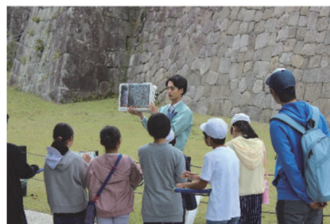
白河の歴史・文化再発見事業の様子