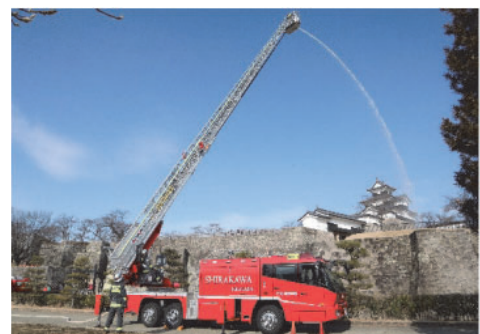
梯上放水訓練の様子

文化財を災害から守り、後世に正しく引き継ぐためには、管理体制の整備が不可欠である。白河市では、「白河市地域防災計画」を定め、文化財管理者への指導として、定期的な防火診断の受診や自主的な点検の実施による火災発生の防止と火災原因の早期発見、消火・警報設備の整備促進などのほか、災害防止のため文化財保存施設の整備として、耐火耐震設備の設置を推進している。現在のところ、消防法で耐火設備の設置を義務付けられている重要文化財（建造物）はないが、火災発生の際、迅速に対応できるよう、義務付けられていない文化財についても自