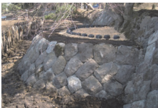
史跡及び名勝南湖公園の護岸整備