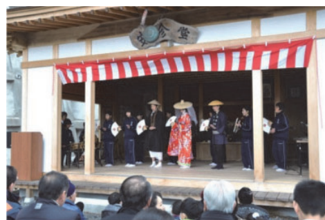
地域の民俗芸能を披露する中学生