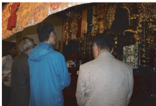
文化財保護審議会現地視察

また、白河市文化財保護条例により、市の諮問機関として文化財保護審議会を設置している。委員は、歴史（中世史）・美術・歴史資料・仏像・建築史・民俗芸能・民俗の専門家7人で構成され、文化財の保存・活用に関する指導・助言を得ている。審議会での検討が困難な分野については、検討委員会や専門委員会を立ち上げる等、適切な審議を行ってきた。今後も、文化財保護行政に対する適切な指導・助言を得ながら文化財の保存・活用を進めていく。