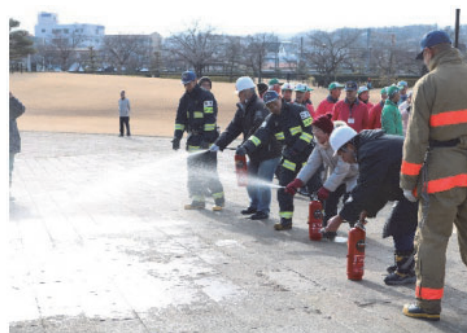
消火器による火災防御訓練

無形民俗文化財等の伝承について、一部地域では、小・中学校の総合的な学習の時間を利用し、地域の無形民俗文化財等を学ぶため、学校と地域が連携して活動を行っている。