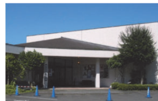
白河市歴史民俗資料館

しかし、その一方で収蔵資料の増加に伴い、資料館収蔵庫のスペース不足が大きな課題となっている。また、発掘調査等で出土した資料の収蔵施設が各所に点在しているため、一括管理・保存を図ることが困難な状況となっている。今後は、財政状況を勘案し、施設改修計画や新たな収蔵施設の確保に努めていく。