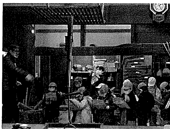
1/29 信夫第一小学校見学会