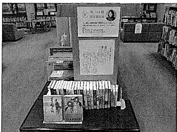
1/20 西條奈加さん直木賞受賞決定 （『涅槃の雪』で第18回中山義秀文学賞受賞）