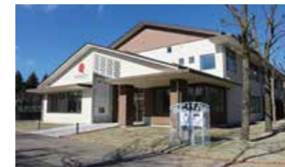
▲アナビススポーツプラザ

9月11日、本市がカタールの「復興ありがとうホストタウン」に登録されました。市は、東日本大震災の際「カタールフレンド基金」からの資金援助で、総合運動公園の改修や、アナビススポーツプラザの新設などを行いました。