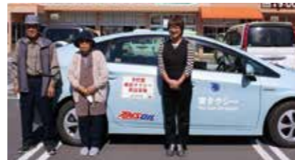
▲東地域乗合タクシー