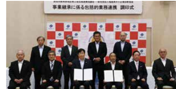
▲協定を締結する本市と西郷村の4商工会と協会関係者

センターでは、中小企業の後継者不在や、事業継続の不安などの相談を受け付けるほか、M&A(企業の合併・吸収)について(一社)福島県中小企業診断協会と連携し支援を行います。