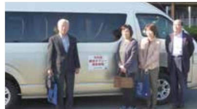
▲表郷・旗宿地域乗合タクシー