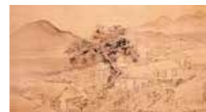
▲高久隆古「山邨馬市図」嘉永元年(1848)

白河藩士の家に生まれた高久隆古をはじめ、江戸時代から現代にかけて、県内の作家を中心に展示します。