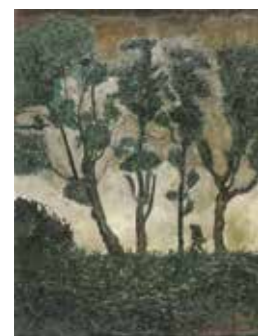
▲関根の初入選作品「死を思ふ日」大正4年(1915)(寄託作品)