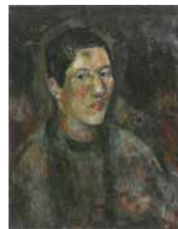
▲亡くなる前年の自画像「自画像」大正7年(1918)