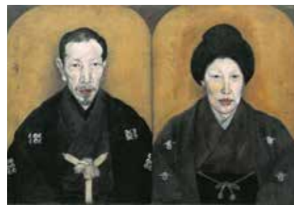
▲白河の夫妻を描いた肖像画「真田吉之助夫妻像」大正7年(1918)