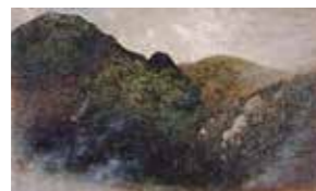
▲高橋由一「栗子山音時景」明治14年(1881)

明治初期の洋画の開拓者として知られる高橋由一や、白河出身の長谷部英一などの作品を展示します。