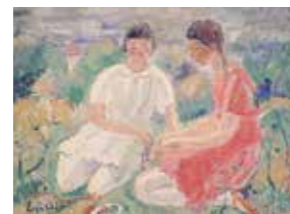
▲長谷部英一「二人の少女」