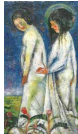
▲晩年の幻想的表現「神の祈り」大正7年(1918)頃