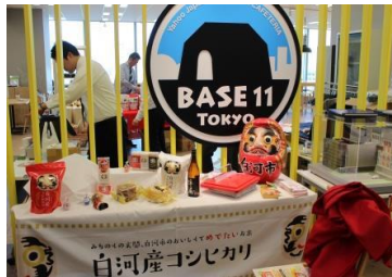
【ヤフー株式会社「白河フェア」】