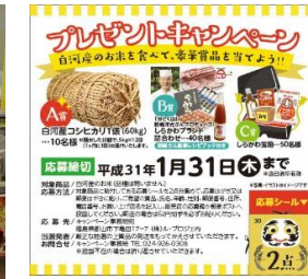
【プレゼントキャンペーン】