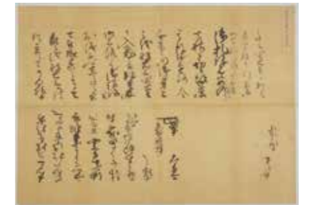
花房秀成書状写 (天正19年2月8日付) (歴史民俗資料館蔵)