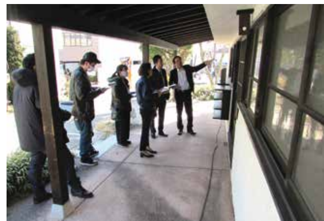
▲実際の物件を説明を受けながら見学できます