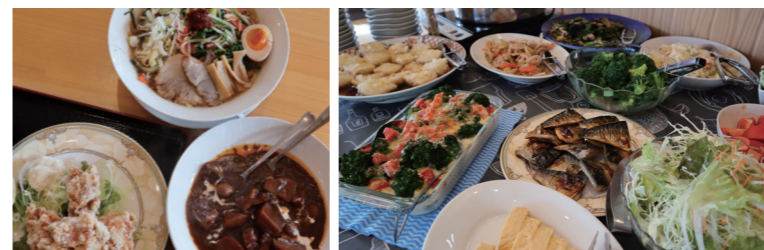
▲店長おすすめの辛子味噌ラーメン、若鶏の唐揚げ定食。この日の日替わりランチはビーフシチュー。10種類以上のお総菜がサラダバーに並びます。