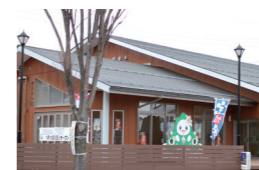
▲ひじりん館は大信庁舎隣