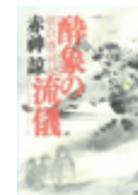
『酔象の流儀 朝倉盛衰記』 赤神諒