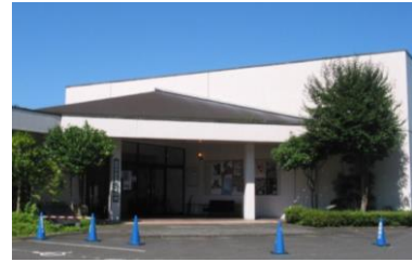
白河市歴史民俗資料館

白河市歴史民俗資料館では、常設展示として白河の古代から近代までの歴史を、展示パネルと実物の収蔵資料を用いて紹介し、昔の人々が遺したものが歴史につなが