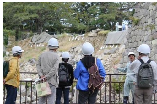
小峰城跡石垣修復箇所一般公開の様子

さらには、東日本大震災により崩落した小峰城跡の石垣修復に対する理解や関心を深めるため、工事の進捗状況や小峰城跡の様子などを定期的に一般公開している。