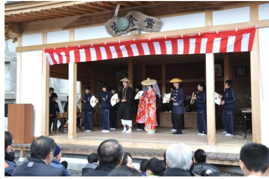
地域の民俗芸能を披露する中学生

介しているほか、すべての指定文化財への誘導・説明板の設置を進めている。また、埋蔵文化財発掘調査の現地説明会を開催しているほか、出前講座事業や各団体の学習会等に積極的に講師派遣を行うなど、文化財に対する知識・理解の高揚に努めている。さらに、文化財保護強調週間及び文化財防火デーに併せた文化財の公開等も実施している。