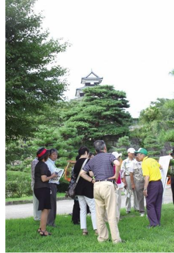
ツーリズムガイド白河による 小峰城の観光案内

また、県指定重要無形民俗文化財「奥州白河歌念仏踊」に関して、白河根田安珍歌念仏踊保存会や大和田町内会の各団体が、地元の小中学生に民俗芸能を継承するための活動を行っている。今後も、これらの団体等と連携して文化財の保存・活用に努めていく。