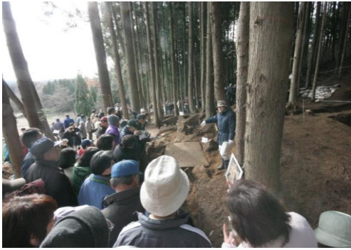
埋蔵文化財現地説明会の様子

市内の文化財を広く市民へ公開し、文化財保護精神の普及・啓発を図るため、白河市ではホームページで国・県・市指定の文化財を写真及び説明付きで分かりやすく紹