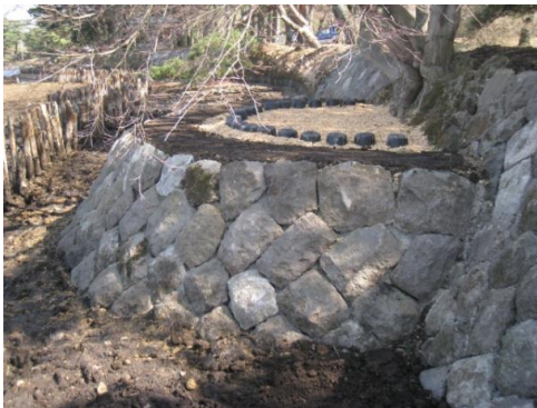
史跡及び名勝南湖公園の護岸整備

今後も、文化財の状況を常に把握した上で、法令に基づき適切な保存を図るとともに、計画的な修理・整備を行う。また、専門的な指導・助言を得ながら、文化財が持つ歴史的価値の保持に努めていく。