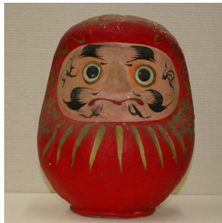
白河だるま(昭和36年製) (白河市歴史民俗資料館蔵)