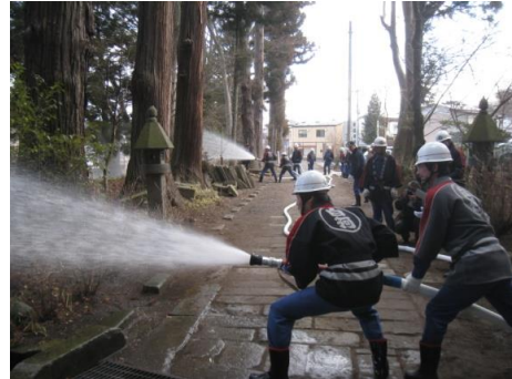
火災防御訓練の様子

今後も、所有者や地域住民、消防機関などの関連機関と連携を図り、更なる防災体制の強化に努めていくとともに、地震や盗難などに対する防災計画についても検討していくよう努める。