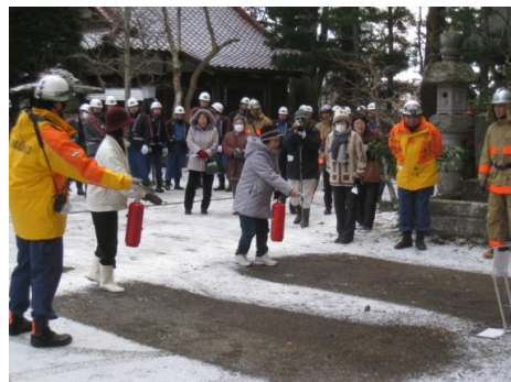
消火器による火災防御訓練