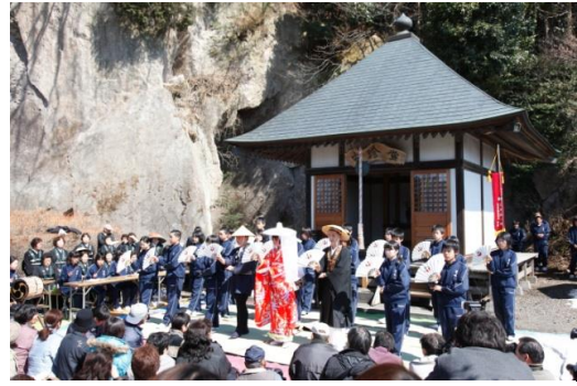
地域の民俗芸能を披露する中学生

介しているほか、すべての指定文化財への誘導・説明板の設置を進めている。また、埋蔵文化財発掘調査の現地説明会を開催しているほか、出前講座事業や各団体の学習会等に積極的に講師派遣を行うなど、文化財に対する知識・理解の高揚に努めている。さらに、文化財保護強調週間及び文化財防火デーに併せた文化財の公開等も実施している。