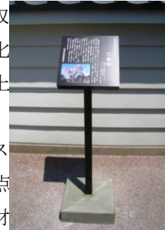
指定文化財説明板