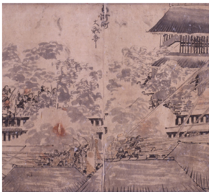
白河口合戦絵巻(白河市歴史民俗資料館蔵)