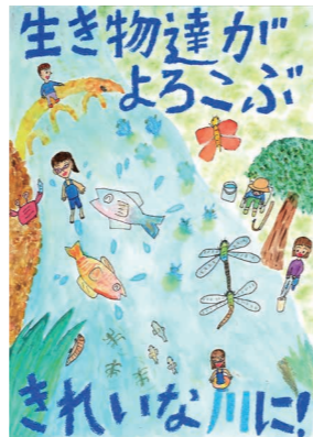
◆ポスター部門 優秀賞 嶋崎桃花さん(白一小5年)