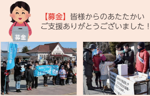
▲立正佼成会 ユニセフ街頭募金 総額80,293円 ▲白河ユネスコ協会 だるま市街頭募金 総額198,153円