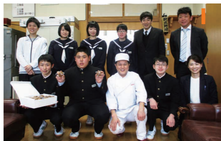
饅頭を食べてパワーをつけ、全力で勉強します!