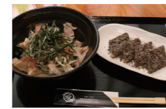
オリジナルそばサラダ(左)と奥会津の甘味はっとう(右)

▷お店の紹介をお願いします 南会津の生の裁ちそばと、いろいろな種類の会津の地酒が楽しめるお店です。 ▷家賃補助制度を利用して 以前は南会津で営業していましたが、補助制度をきっかけに、白河で新たにお店を出すことを決めました。市民の方々の声を聞き、長く続けていきたいと思えます。 ▷店主から一言 今後は山菜やヤマメの刺身、馬刺しなど会津料理のメニューをより充実させる予定です。ぜひ一度食べに来てください!