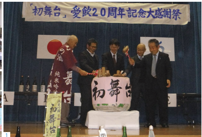
1_「初舞台愛飲♥20周年記念大感謝祭」での鏡開きの様子。 2_20周年を祝い、約130人の方が参加しました。 3_一升瓶2,800円・四合瓶1,550円 (税込)、大信地域のお酒取り扱い店で数量限定販売中! お求めはお早めに!