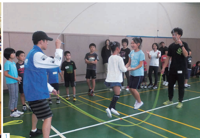
1_9月に行われた「ダブルダッチワークショップ」の様子。 2_プロダブルダッチチーム (REGSTYLE) がアクロバティックな技で子どもたちを魅了。 3_多くの子どもたちがダブルダッチで達成感を味わいました。