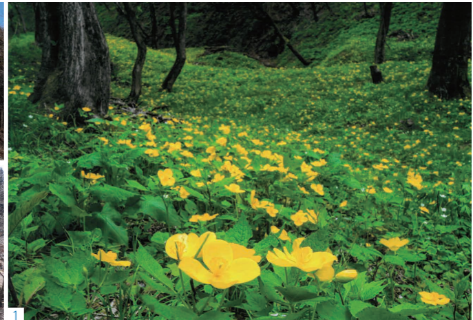
1_ヤマブキソウの群生地。その他、カタクリ、ヤマツツジ、ニリンソウなどが見られます。 2_遊歩道入り口に整備された駐車場 (100台以上駐車可)。 3_遊歩道案内板。約1.8kmのお花畑コースと、約2.5kmの登山コースがあります。