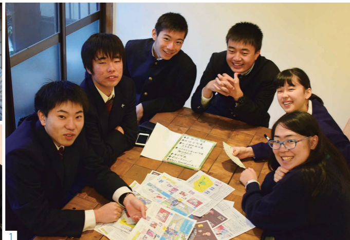
1_白河高から4人、白河実業高から1人、光南高から1人、計6人で取材しました。 2_取材内容など話し合う様子。 3_「ヨリミチ」は市役所・市立図書館・コミネスなどに置いてあります。「裏庭」ホームページ (P3参照) からも見られます。