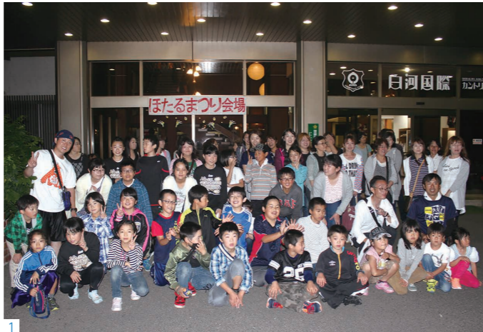
1_地域のゴルフ場で開催された「ホテル祭り」には、多くの子どもたちが参加しました 2_「そばの花見会&寺コンサート」の様子 3_「新そば祭り」の様子。小学生の学習発表の場にもなっています