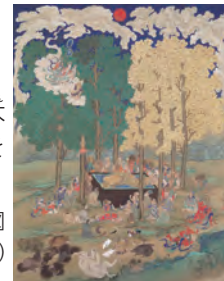
谷文晁筆 仏涅槃図 (大統寺蔵、白河市歴史民俗資料館寄託)