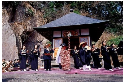
奥州白河歌念仏踊

奥州白河歌念仏踊（県指定）は、白河付近の村々に伝承されている。根田組、久田野組、釜の子組、柏野組、羽太組等それぞれの集落にある念仏踊りは、村内安全と五穀豊穡を祈ることに始まったといわれるが、長い間に舞踊化し、交情和親の娯楽ともなっており、各村に定着した。なお、根田地区においては「道成寺物語」の安珍僧が、市内萱根の生まれと伝えられ、これにちなんだ歌詞や踊りがあるので「安珍念仏踊」として有名である。旧暦2月27日（現在は3月27日）の安珍忌には歌と踊りで供養する。