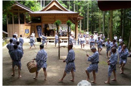
関辺のさんじもさ踊

関辺のさんじもさ踊（県指定）は、関辺地区に伝わるもので、天道（太陽）に正常な運行と害虫の防除を念じて、五穀の豊作を祈る神事である。はやしことばから、さんじもさ踊りと呼ばれ、「むけの朔日」（旧暦6月1日）の行事だったが、現在はその前後の日曜日に関辺の鎮守八幡神社で氏子の青年たちによって行われている。