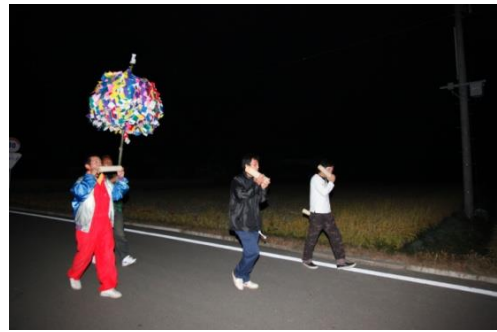
中ノ沢権現梵天祭

中ノ沢権現梵天祭（市指定）は、表郷梁森地区に伝わるもので、大山祇神を祀る中ノ沢権現で、五穀豊穡を祈願し行われるようになったといわれている。奉幣は、隔年旧暦8月8日に行われている。