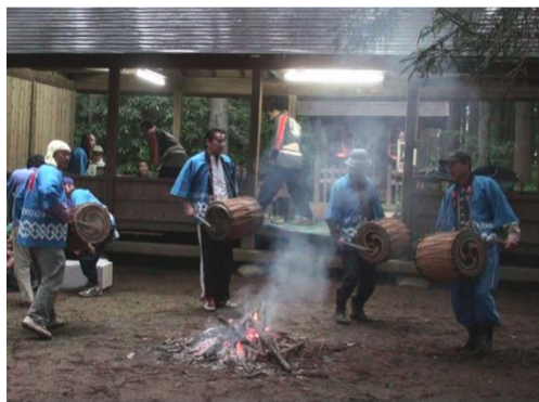
河東田牛頭天王祭

河東田牛頭天王祭（市指定）は、表郷河東田地区に伝わる祭礼である。牛頭天王は、インドの祇園精舎の守護神で、除疫神として祀られた。由来より考えると旧暦6月の祭事であり一種の夏越萩であり、胡瓜天王の謂から農神としても崇められた祭神である。祭礼は現在も継承され、毎年6月14日・15日に実施されている。現在は、地区にある4基の太鼓を打ち鳴らし祭礼を盛り上げている。胡瓜を祭壇に供え五穀豊穡を祈る風習のあるところから、別に「胡瓜天王様」ともいわれている。