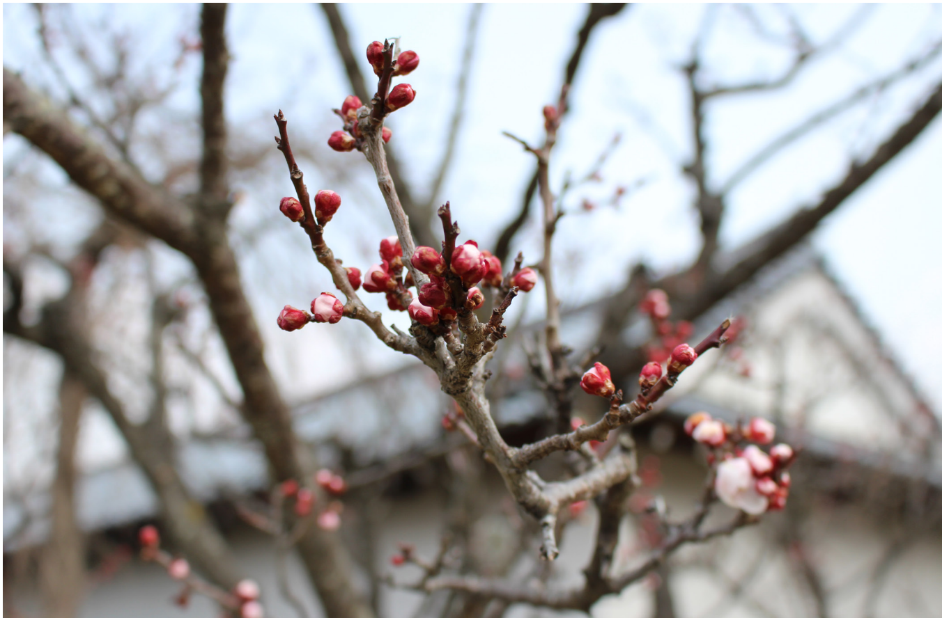
春の訪れを告げる梅の花「小峰城」(3月19日)