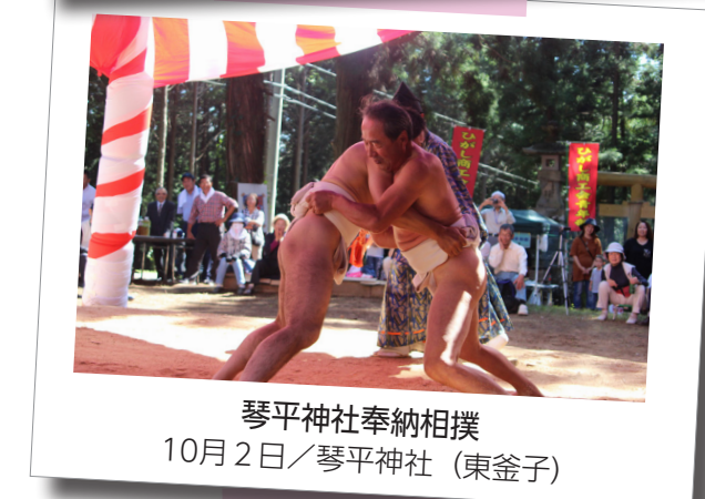
琴平神社奉納相撲 10月2日/琴平神社 (東釜子)