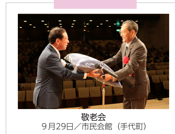
敬老会 9月29日/市民会館 (手代町)