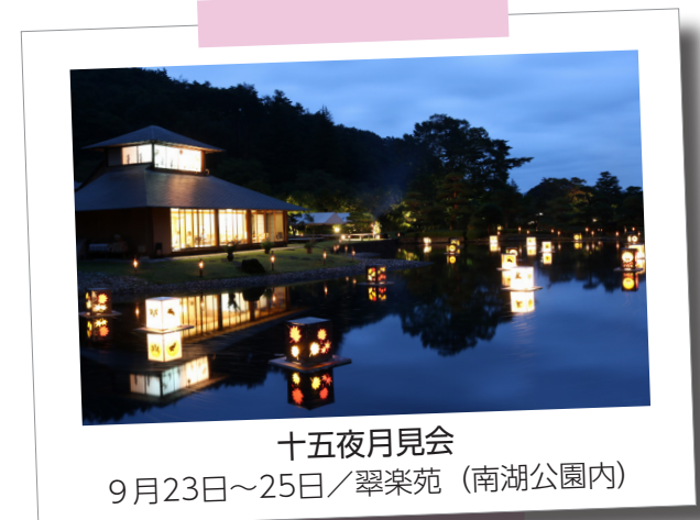
十五夜月見会 9月23日～25日/翠楽苑 (南湖公園内)