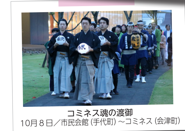
コミネス魂の渡御 10月8日/市民会館 (手代町) ～コミネス (会津町)