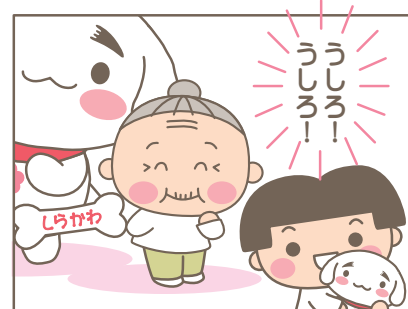
しあわせの「めんこい」の連鎖