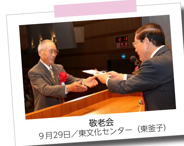
敬老会 9月29日/東文化センター (東釜子)