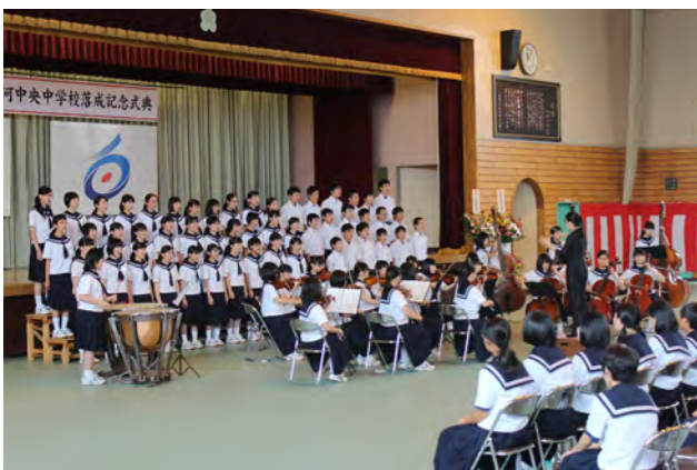
▲ヘンデル作曲「ハレルヤ」を披露する器楽部と特設声楽部

「ひじりん館」オープン 新たな地域交流・情報発信拠点 7月2日、大信地域市民交流センター「ひじりん館」のオープニングセレモニーが行われました。この施設は、地域住民が気軽に交流し、食を楽しむ、地元の情報発信する場です。館内には、物販スペース「たにしんの幸商店」や飲食スペース「四季彩キッチン田―Den」のほか、ボルダリングなどが楽しめる子ども広場が設置されています。式典では、オープンを祝い、関係者がテープカットを行ったほか、大信赤十字奉仕団が「大信大黒舞」を披露しました。