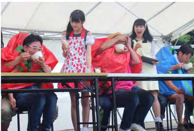
▲会場を盛り上げた二人羽織わんこ早食い競争

アフターDCクロージングイベント 勝どきをあげ更なる魅力発信を誓う 6月26日、JR新白河駅で、「ふくしまアフターDC（ドステイネーションキャンペーン）」のクロージングイベントが行われました。大信こだま太鼓の演奏とともに、白河歴史文化協会甲冑隊が駅利用者を出迎えました。式典では、一日駅長に就任したダルライザーから、DCを盛り上げた団体の代表者へ、駅長が描かれたピンクの白河だるまが手渡されました。最後には、更なる地域の魅力発信を誓い、同甲冑隊の発声で関係者全員が勝どきをあげました。