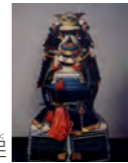
紺裾濃糸威二枚胴具足