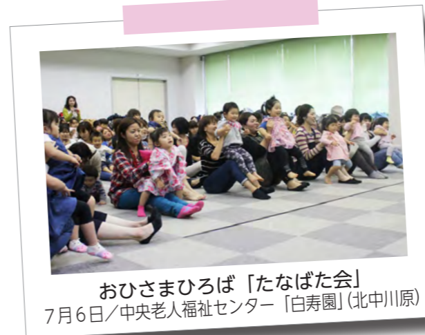
おひさまひろば「たなばた会」 7月6日/中央老人福祉センター「白寿園」(北中川原)