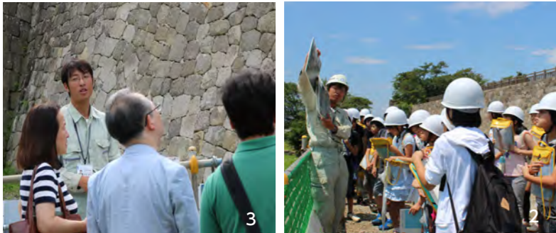
1. 竹之丸南面石垣修復現場の一般公開 (7月3日) 2. 体験学習で作業現場を見学 (関辺小6年生) 3. 修復された石垣を見上げる見学者