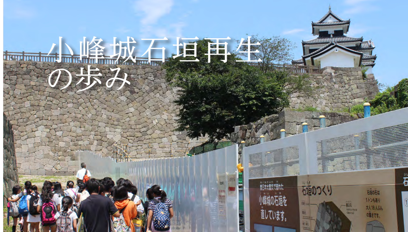
▲復元された本丸南面の石垣を見学する子どもたち（7月14日／関辺小6年生体験学習）