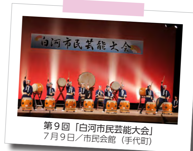
第9回「白河市民芸能大会」 7月9日/市民会館 (手代町)