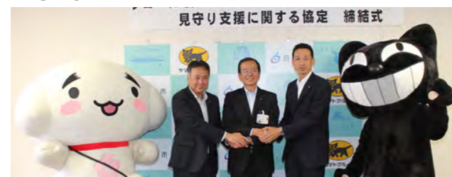
△ヤマト運輸(株)・ヤマトマルチメンテナンソソリューションズ(株)との協定締結の様子 (6月16日)