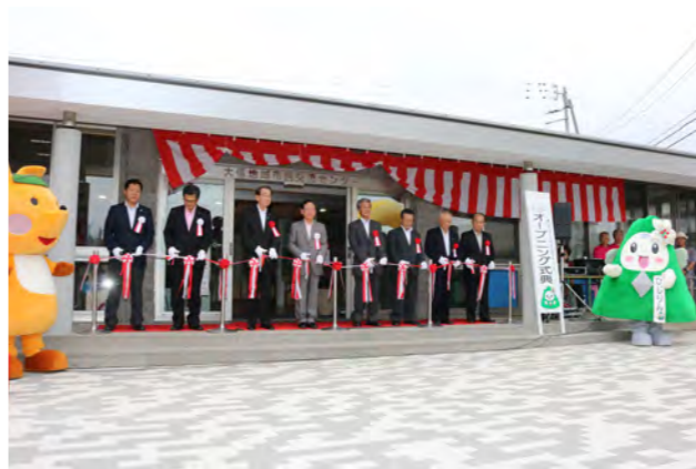
▲テープカットの様子

第2回県南S・1グランプリinたいしん 多彩な催しとご当地グルメを堪能 7月9日、大信総合運動公園（大信上新城）で「第2回県南S・1グランプリinたいしん」が行われました。県南地方の11商工会青年部による地元の食材を使ったご当地グルメ対決が行われ、来場者による投票の結果、白河高原清流豚を使用したホッ豚ドックが1位に輝きました。また、各地域のゆるキャラによるイベントや、幅5cm×長さ40cmの「聖うどん」を使った二人羽織わんこ早食い競争など、多彩な催しが繰り広げられ、会場は大いに盛り上がりしました。