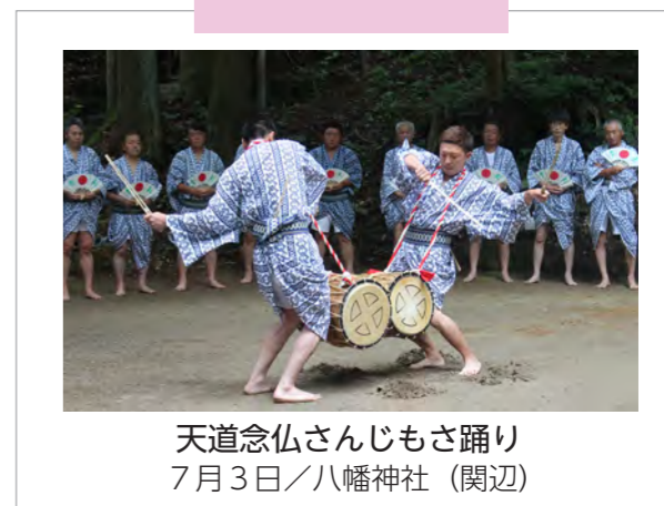
天道念仏さんじもさ踊り 7月3日/八幡神社 (関辺)

季節の風景や地域のイベントなど、市民の皆さんが市内で撮影した写真を募集しています。投稿いただいた写真は、広報白河で紹介いたします。