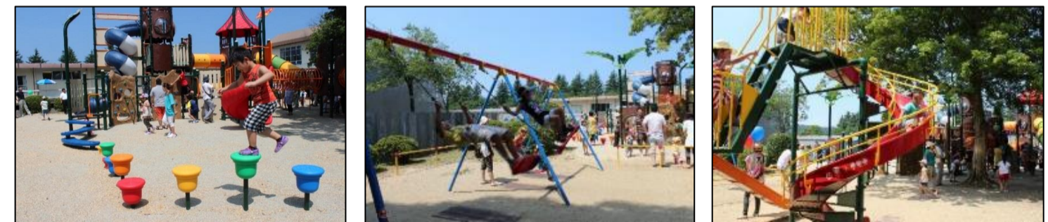
H26.7.26(オープニングセレモニー時の様子)