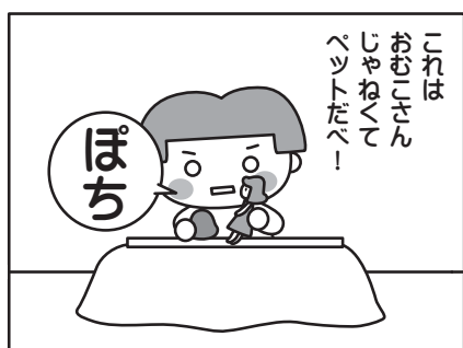
ダルマに名前をつけてあげましたとさ