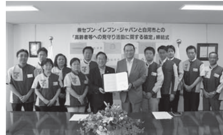
▲(株)セブン-イレブン・ジャパンとの協定締結式