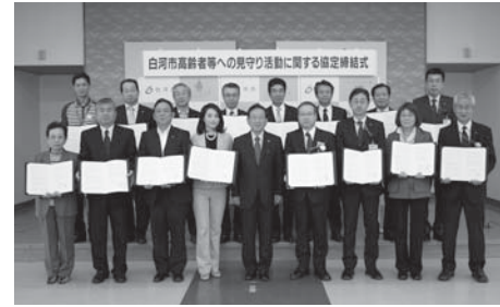
▲21企業・団体との協定締結式