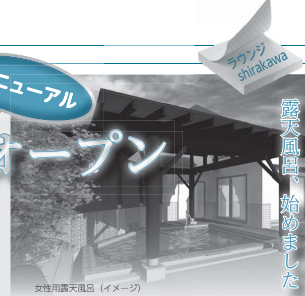
女性用露天風呂(イメージ)