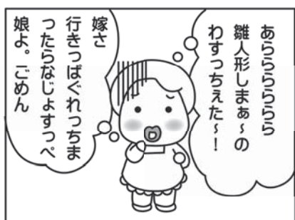
雛人形をしまい忘れた母親はこう思いがち