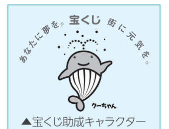
▲宝くじ助成キャラクター