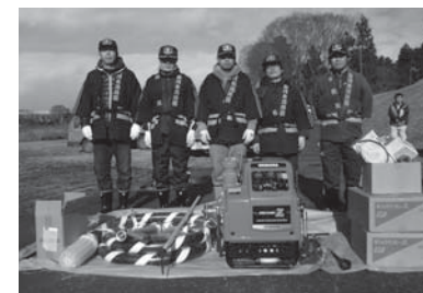
▲第5分団第2部第2班の皆さん

今回の装備拡充によって、消防団を先頭に地区の防火・防災体制がより強化されました。