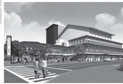
▲白河文化交流館（平成28年度完成予定）