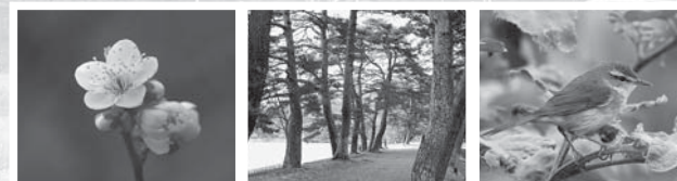
▲市の花（ウメ）・木（アカマツ）・鳥（ウグイス）