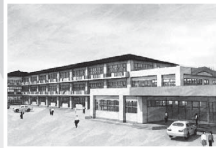
▲中央中（平成27年度完成予定）

ることに加え、伝統と文化の息づく歴史のまちです。地方創生が叫ばれる中、足元にある資源を磨き活かしながら、これからの地域をどのように創っていくのかをみんなで考え、広く意見を聴き、誇りと愛着をもてるまちになるよう、一步一步前に進んでいきます。