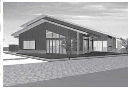
▲大信地域市民交流センター（仮称）（平成28年度完成予定）