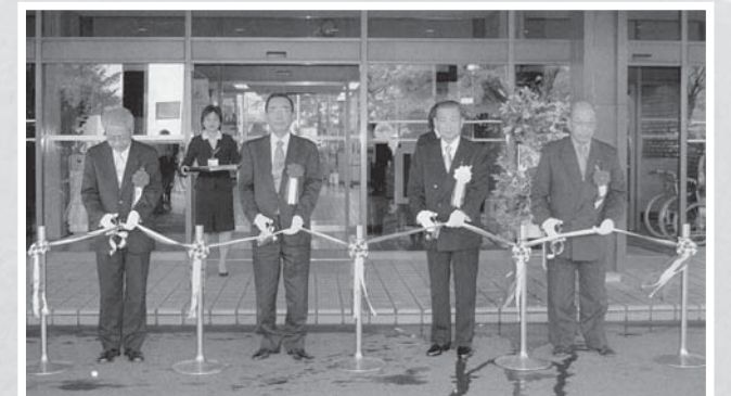
▲白河市・表郷村・大信村・東村が合併し、新「白河市」誕生