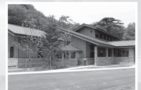
▲聖ヶ岩ビジターセンター