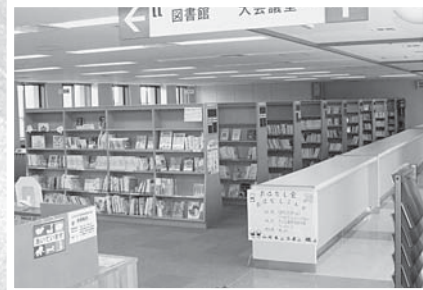
▲市立図書館表郷分館