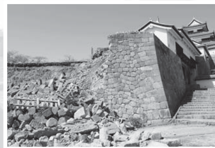
▲東日本大震災（写真は小峰城）