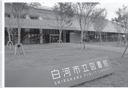
▲市立図書館Libran〜りぶらん〜