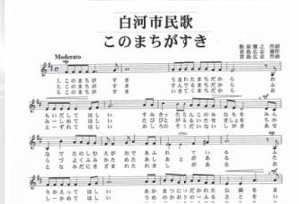
▲市民歌「このまちがすき」