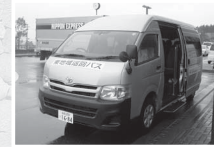
▲東地域巡回バス新車両