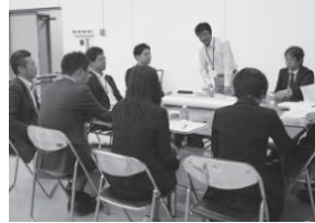
▲市民ワーキンググループの様子

このことから、本市の総合戦略では、安定した雇用を確保するため、企業誘致を含めた地域産業全体の底上げを行うとともに、地域に愛着と誇りを持った人材の育成と市民主体のまちづくりを進め、人々が安心して生活し、子どもを生み育てられる社会環境を整えていきます。