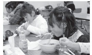
▲限定ラーメンを食べる子どもたち

ほかにも同会場で「手づくり甲冑絵巻展」が、JR白河駅前イベント広場で「白河ご当地キャラ・ヒーローフェスタinだるま市」が同時開催され、それぞれにたくさんの方が訪れ楽しんでいました。