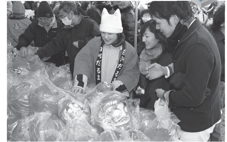
▲福を求める来場者でにぎわう会場