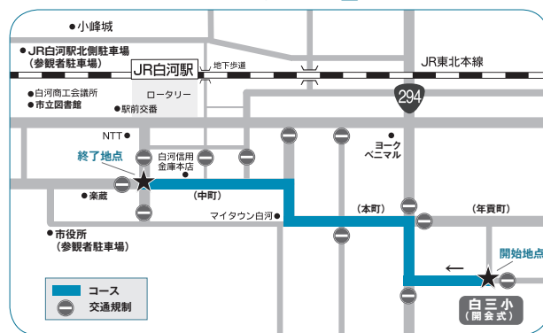
◁パレードコース図>