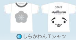
●しらかわんTシャツ

☎ご当地キャラこども夢フェスタinしらかわ実行委員会（本庁舎観光課内） ☎1111 内2214