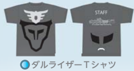
●ダルライザーTシャツ

※当日は、このTシャツを着ただけ、来場された方におもてなしをしていただきます。なお、Tシャツのデザインは現在検討中のため、変更する場合があります。