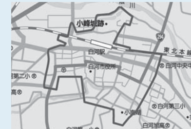
▲基本計画区域（太線で囲まれたエリア）

基本計画区域内の「民間賃貸住宅」 ※市営住宅などの公的賃貸住宅、社宅・寮などの事業主の給与住宅、2親等以内の親族が所有している住宅は補助対象にはなりません。