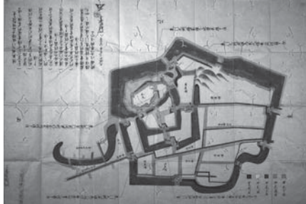
▶天保10年に提出された修復願図控え(学習院大学史料館寄託、阿部家文書)

本市のシンボル小峰城。東日本大震災で石垣が崩落し、現在、修復作業を進めています。「小峰城石垣再生への歩み」では、修復作業の様子や再生に向けた取り組みをお知らせします。 小峰城は国指定史跡のため、文化庁の許可を得て石垣修復工事を行っています。実は、江戸時代においても、石垣を修復する際には幕府の許可が必要でした。これは、「元和元年(1615)」に幕府が発布した「武家諸法度」で定められ、居城を修復する際は、幕府に届け出ることが義務付けられていました。 小峰城の本丸南面石垣は、天保10年(1839)に修復願いが提出されていて、その控えが現在も残っています。こうした記録を調べることで、石垣の修復時期や原因、範囲、箇所などが分かるほか、弱点や積み方の変遷が見えてきます。 今行われている修復も詳細な記録を作成し、江戸時代から伝わる修復履歴の中に加え、後世に残していきます。