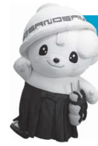
さのまる (栃木県佐野市)

佐野らーめんのお椀の笠に、いもフライの剣を持ち、佐野の城下町に住んでいる侍。世界に佐野の魅力をアピールすべく、笠には外国の方にも分かるようローマ字で「SANO」と書かれています。