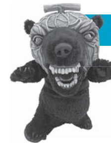
メロン熊 (北海道夕張市)

夕張のおいしいメロンを食い荒らして変ぼうした熊。噛みつくのがおなじみのパフォーマンスです。怖がらないで、心ゆくまでメロン熊と触れあいましょう。