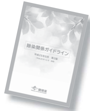
除染関係ガイドライン