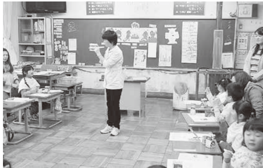
▲歯科衛生士による歯みがき指導

体力テストの結果をもとに授業や業間体育に力を入れています。また、健康な生活を営むために歯みがき指導にも取り組み、生活習慣の改善を図っています。